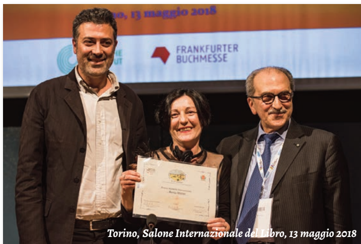
Torino, Salone Internazionale del Libro, 13 maggio 2018

La sua lingua scolpita continua a raccontarle, con impietosa, struggente poesia.